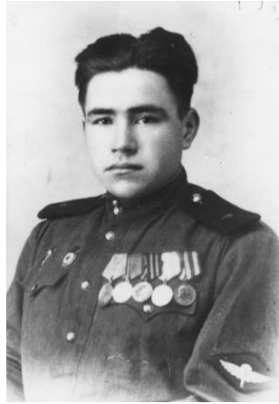
г. Полоцк, февраль 1949 г.