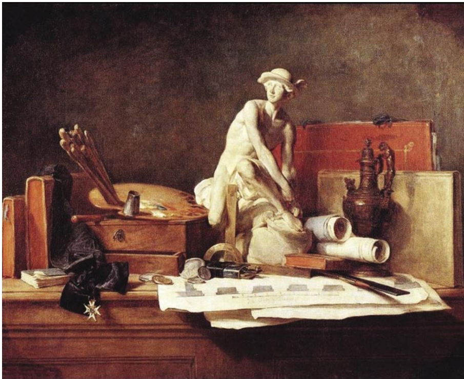
Рис. 4. Жан Батист Шарден. Натюрморт с атрибутами искусств. 1766 г.

У ряда художников того времени задача раскрытия социального