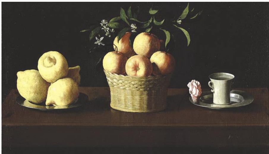
Рис. 2. Франсиско де Сурбаран. Натюрморт с лимонами, апельсинами и розой. 1633 г.

В своей «Книге о живописи» Леонардо да Винчи так же, как и Дюрер, смотрит на изобразительное искусство как на серьезную научную дисциплину. Труды художников Возрождения по вопросам перспективы помогли справиться с труднейшей проблемой построения трехмерной объемной формы изображения предметов на двухмерной плоскости листа (рис. 2). Именно они положили начало развитию методики обучения и наметили перспективы рисования как учебного предмета.