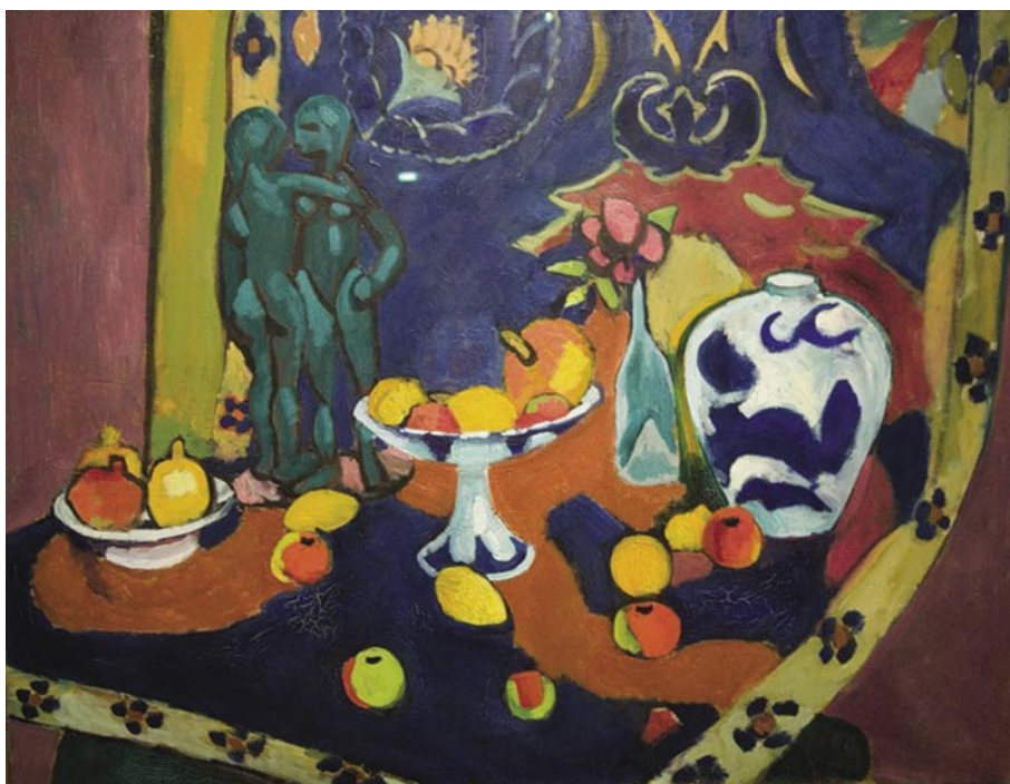
Рис. 6. Анри Матисс. Фрукты и бронза. 1909 г.

XVIII века. Одними из первых мастерами натюрморта были П. Г. Богомолов, Г. Н. Теплов. Определенный вклад в развитие русского натюрморта XIX века внесли А. Г. Венецианов Ф. П. Толстой, И. Ф. Хруцкий, изображавшие в основном цветочные мотивы, фрукты, простые и несложные сюжеты, передавая красоту обыденного. В работах В. Маковского, В. Петрова, В. Поленова, П. Федотова и других живописцев демократического направления натюрморт, написанный в жанровых картинах, помогал раскрывать и усиливать социальную направленность произведения, передовая дух того времени. Реалистическое направление в живописи натюрморта очень ярко демонстрирует творчество А. Г. Венецианова. Предмет в живописи А. Г. Венецианова не является аксессуаром, он неразрывно связан с сюжетом картины, зачастую является ключом к пониманию образа, хотя мастер и не выделял его, органично соединив в своих жанровых работах.