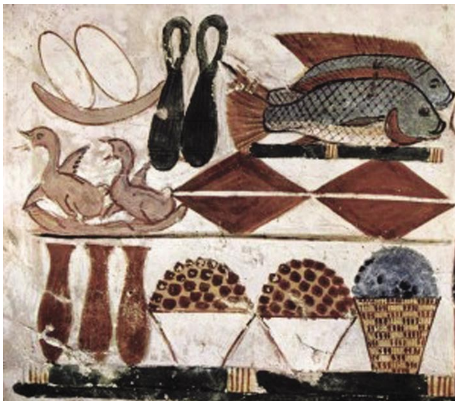
Рис. 1. Гробница Менны, писца ведомства пашен фараона. Жертвенные дары. Около 1422–1411 гг до нашей эры. Стенная роспись Фивы. Гробница Мены

Но если в Древнем Египте обучение рисованию строилось не на основе познания окружающего мира, а на заучивании схем, канонов и копировании образцов, то уже в Древней Греции рисование рассматривается как общеобразовательный предмет. Греческие педагоги в основу рисования положили натуральный метод. Глава Сикионской школы Поморил ввел рисование во все образовательные школы Греции, он первым выявил, что в задачу обучения рисования входит прежде всего познание закономерностей предметов окружающей действительности (рис. 1).